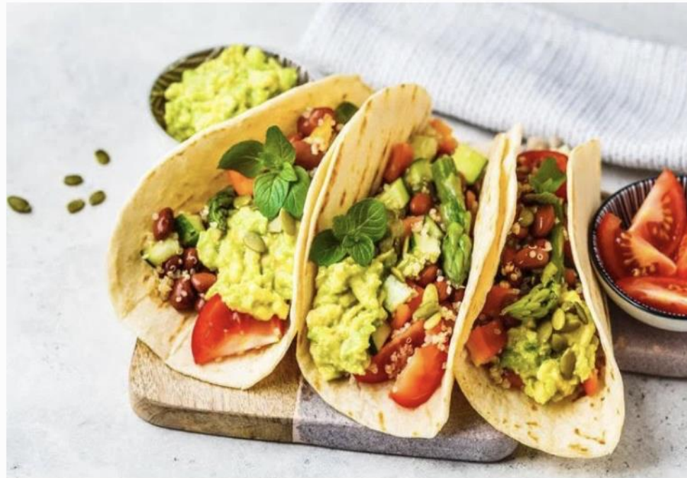
Vegan tortilla wraps with quinoa, asparagus,...